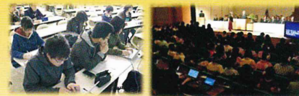
授業でのパソコンテイク 大学行事でのパソコンテイク

本学の障がい学生支援の始まりは学生達が自主的に立ち上げたバリアフリー委員会でした。その後、教職員組織としてのアクセシビリティ推進委員会が設置され、現在に至っています。学生同士の相互扶助、成長の気風は受け継がれ、障がいのある学生への情報保障、通学介助などの必要な支援等に直接かかわっているのは、多くの在学生たちです。テイク技術を学ぶための講習会、介助の講習会、手話の勉強会なども行います。初めての方でも技術を身につける機会はたくさんあります。支援活動を行うと、大学で定める謝金が支給されます。サポートセンターでは、支援学生（アクセシビリティ・学生スタッフ）を随時募集しています。