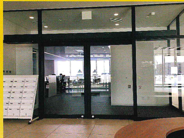
新札幌キャンパス:サポートセンター(1階事務室内)