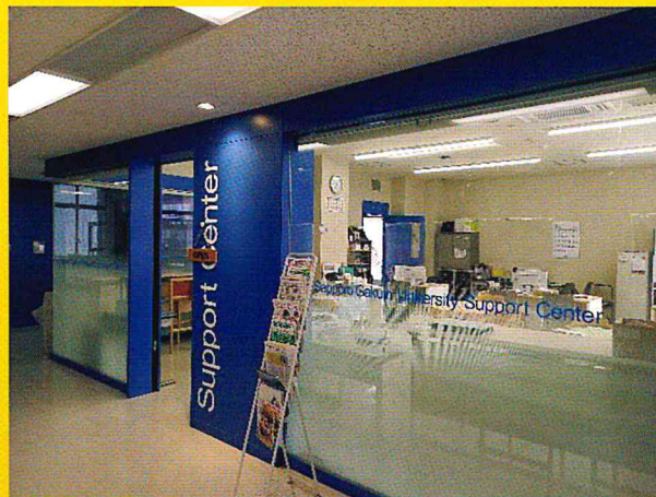
江別キャンパス:サポートセンター