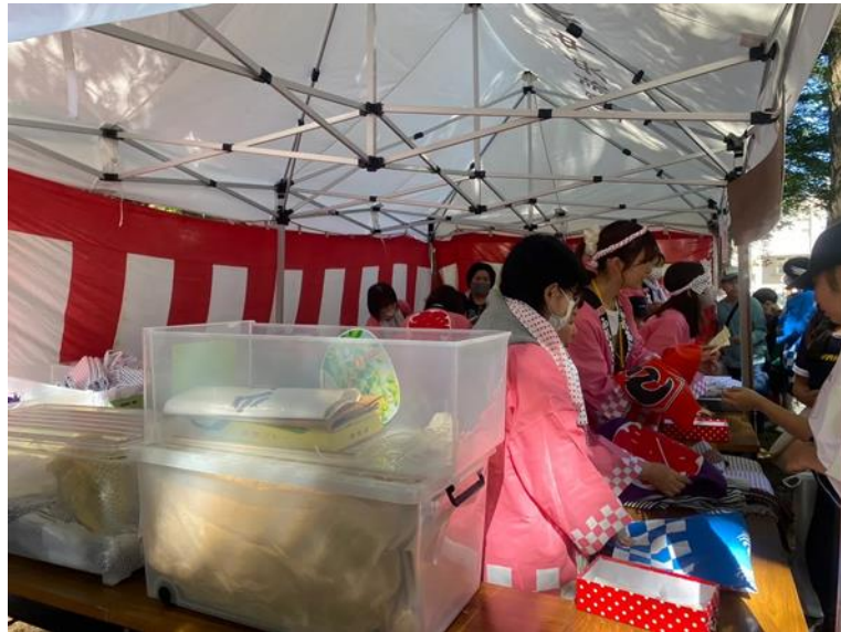
9月実施 『信濃神社秋祭り子供神輿』