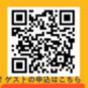
↑ゲストの申込はこちら