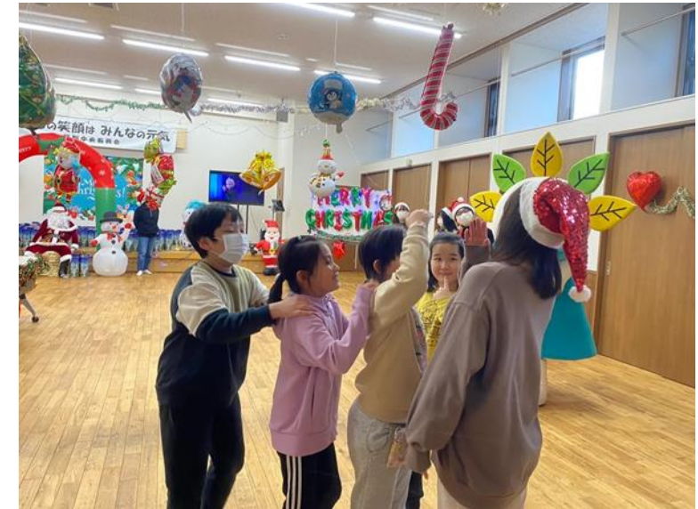
12月実施 『こども食堂クリスマスパーティー』