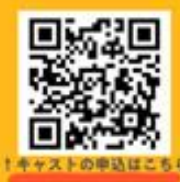
↑キャストの申込はこちら

▼参加者(ゲスト)予約 人数把握のため事前予約制となっております。下のQRコードから予約をお願いします。