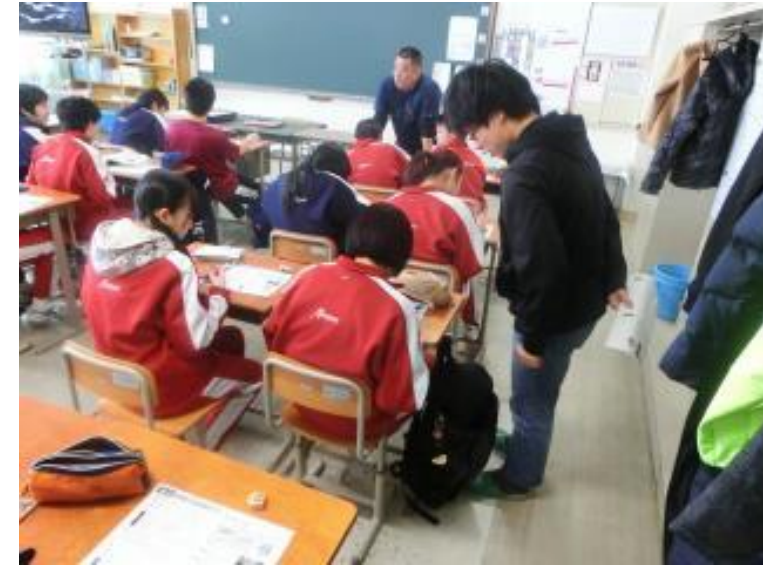
北海道教育委員会学校 サポーター派遣事業