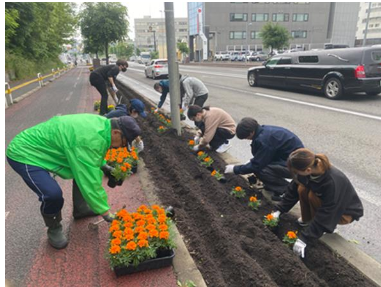
10月実施 『国道12号花植え』